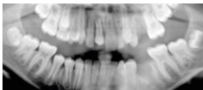
Abb. 2: Röntgenbild nach Zahntransplantation

Hier wurde ein Prämolare vom Unterkiefer links in die Lücke transplantiert und zum Ausgleich ein Prämolare im Oberkiefer links entfernt (Abb. 1 und 2). Nach erfolgreicher Einheilung wurde mithilfe der Klebetechnik vom Hauszahnarzt die Schneidekante mit Kunststoff aufgebaut. Der Zahn ist vital und reagiert auf Kälte wie ein gesunder Zahn. Nach 6 Jahren konnte die Patientin anlässlich der Weisheitszahnentfernung untersucht werden. Nicht nur der transplantierte Zahn, sondern auch der umgebende Kieferknochen hat sich völlig normal entwickelt, sodass das Zahntransplantat nur nach genauer Betrachtung erkennbar ist (Abb. 3).