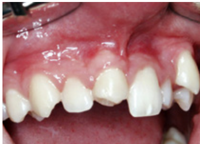
Abb. 1: Zustand nach Zahntransplantation

Der transplantierte Zahn darf dann allerdings noch nicht ausgewachsen sein. Im Idealfall sollte die Wurzellänge etwa 2/3 des ausgewachsenen Zustands betragen. Besonders bei Zahnengstand bietet sich die Transplantation eines Prämolaren an (Abb. 1 und 2).