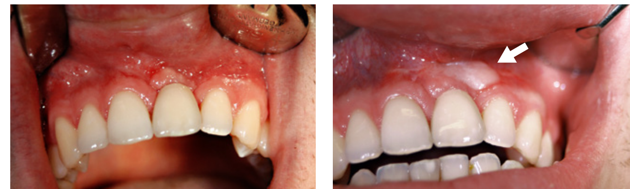
Abb. 7 links: Zustand nach Implantatversorgung und provisorischer Prothetik rechts: endgültiger Zahnersatz nach Schleimhauttransplantat (Pfeil) und Narbenkorrektur