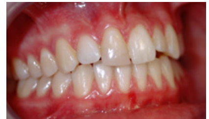
Abb. 3: Die gleiche Patientin 6 Jahre später – im Alter von 17 Jahren. Der transplantierte Zahn erhielt einen Schneidekantenaufbau mit Kunststoff durch den Hauszahnarzt.

Hier wurde ein Prämolare vom Unterkiefer links in die Lücke transplantiert und zum Ausgleich ein Prämolare im Oberkiefer links entfernt (Abb. 1 und 2). Nach erfolgreicher Einheilung wurde mithilfe der Klebetechnik vom Hauszahnarzt die Schneidekante mit Kunststoff aufgebaut. Der Zahn ist vital und reagiert auf Kälte wie ein gesunder Zahn. Nach 6 Jahren konnte die Patientin anlässlich der Weisheitszahnentfernung untersucht werden. Nicht nur der transplantierte Zahn, sondern auch der umgebende Kieferknochen hat sich völlig normal entwickelt, sodass das Zahntransplantat nur nach genauer Betrachtung erkennbar ist (Abb. 3).