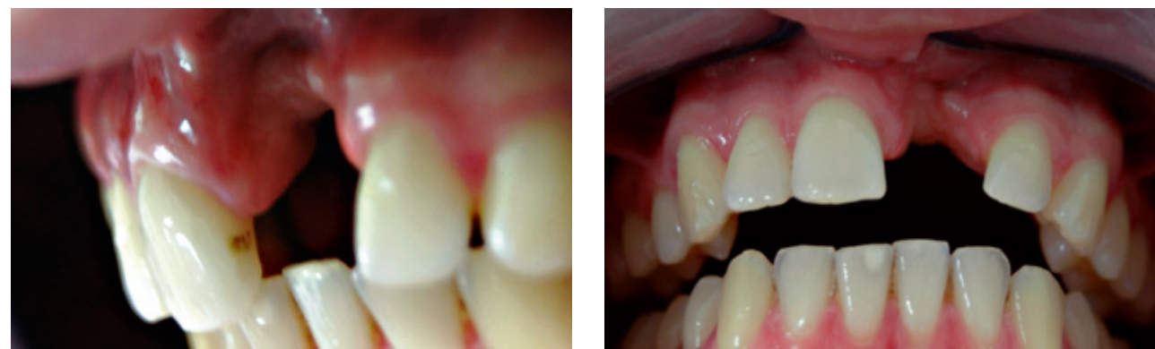
Abb. 4: Ausgeprägter Knochen-Weichteildefekt nach Frontzahnverlust

▪ Ort des Zahnverlusts Im Bereich der Kieferhöhle führt Zahnlosigkeit zu besonders starkem Abbau, da